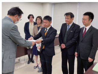
島根の県議・国政予定候補らとともに防衛局へ要請

2月22日、島根の皆さんとともに中国四国防衛局へ。担当者からは「米軍の個々の訓練については承知していない」「調査するつもりはない」と驚くべき答弁が。「一体、あなた方は誰を守っているのか。国民ではなくアメリカを守っているのではないかと無責任な姿勢を正面から批判し、徹底した実態調査と訓練中止を重ねて求めました。」