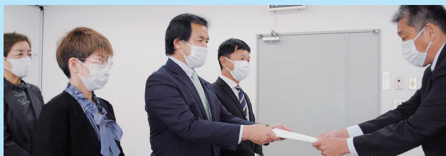
防衛局への申し入れ

11月7日、中国四国防衛局へ10日から行う予定の岡山空港を使用するの「自衛隊統合演習」の中止を求めました。「なぜ民間空港、岡山空港を使用するのか」という基本的な問いから訓練の目的や内容についてまで、こちらからの質問に担当者はほとんど未回答。防衛省内のガバナンスについても抗議しました。その後、訓練は強行され周辺住民の不安の声や爆音被害などが寄せられ、後日、防衛省にも抗議の申し入れに行きました。