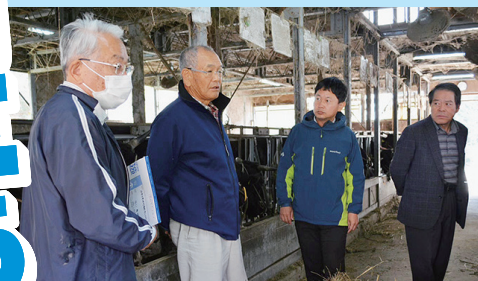
繁殖農家から話を聞く

11月9日、庄原市東城町の繁殖・酪農・米農家を訪問。皆さん口をそろえて「売上が変わらない中、飼料や肥料、農薬、資材、燃油とあらゆるものが値上がりしている」「水田活用交付金の改悪は許されない」と悲鳴や怒りが。「あと5年、今の農政が続けばもう日本の農業は終わる」と話す農家も。緊急の物価高騰対策とともに、抜本的な所得支援策の実現へ全力を尽くします。