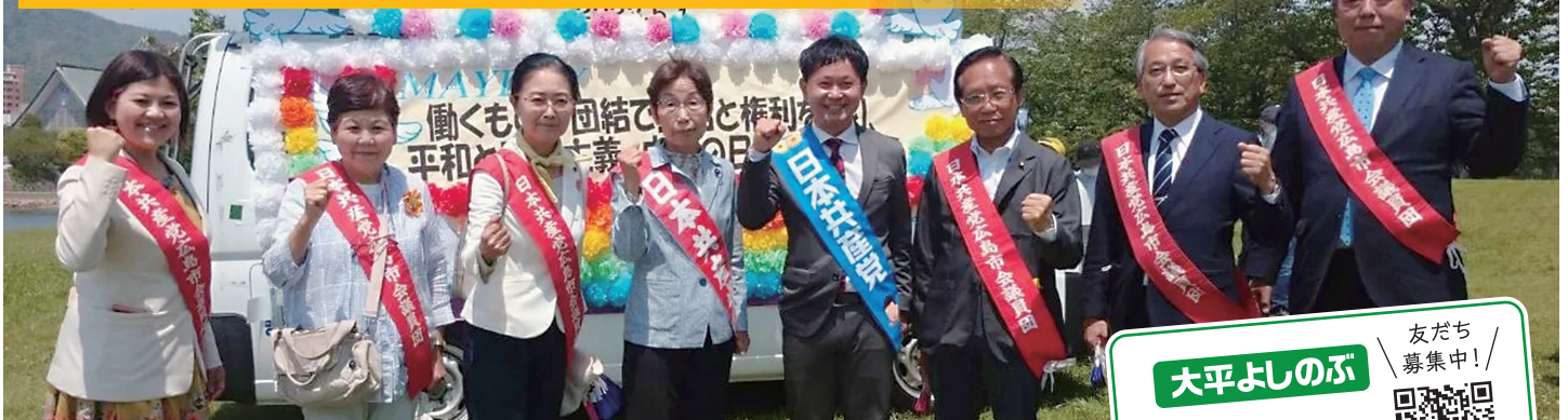
5月1日、広島県中央メーデー会場で新しい県議、広島市議団とともに