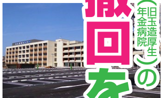
写真は松江医療センターホームページより