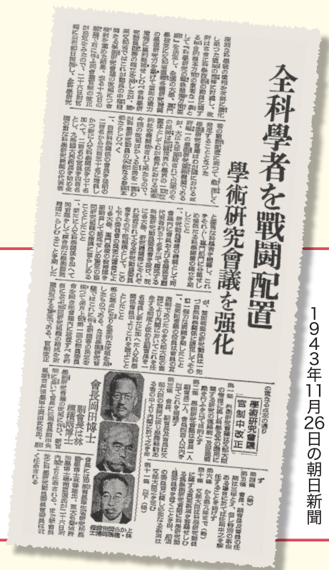
1943年11月26日の朝日新聞

強権をもって異論を排斥する。こんな独裁政治に未来はありません。日本共産党は、違憲・違法の任命拒否の撤回を強く求めます。