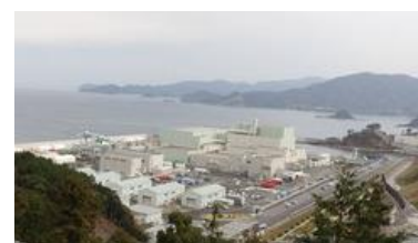
島根原発 (松江市鹿島町)