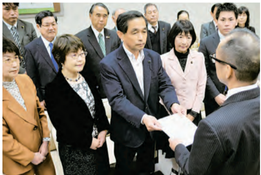
●玄海原発再稼働“拙速同意しないで”超党派21議員が佐賀県知事に要請＝4月6日・佐賀市

原発再稼働をすすめる安倍政権。「超党派で佐賀県知事へ再稼働同意をしないように要請」(佐賀・福岡・長崎)、「鹿嶋市、土浦市で東海第二原発20年延長に反対意見書」(茨城)、「上関原発撤回で県民集会」(山口)——日本共産党は再稼働・建設ストップへ共同。 電力会社や原発関連企業から、献金を受けとらない党だから、ぶれません。