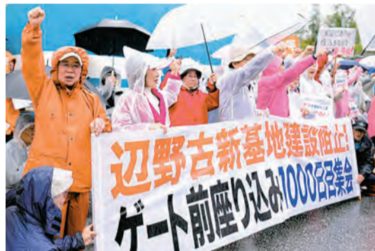
●違法な岩礁破碎工の即時ストップを訴える集会参加者＝4月1日、米軍キャンプ・シュワブ前

安倍政権は、沖縄・名護市辺野古に新基地建設の工事を強行。これに対し、「勝つ方法はあきらめないこと」と、日本共産党は「オール沖縄」で県民とともに、運動をしています。 沖縄と連帯し、「オスプレイ来るな」と東京、群馬、長野、新潟、佐賀など全国各地で、集会・抗議行動が行われ、党派をこえて力をあわせています。