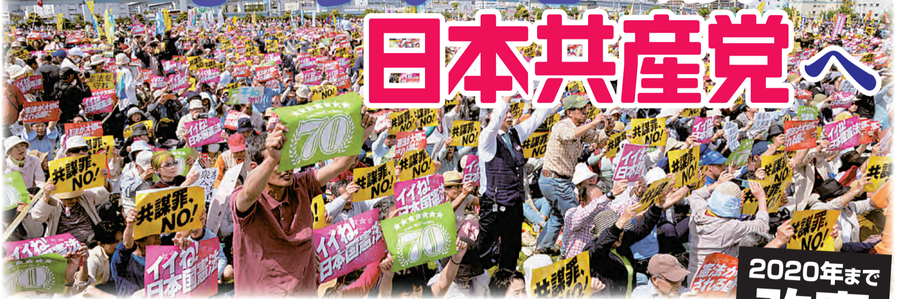
「いいね!日本国憲法—平和といのちと人権を! 5・3 憲法集会」に5万5千人が声援=5月3日、東京都江東区