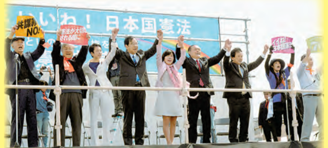
「5・3 憲法集会」でアピールコールする4野党1会派の代表と市民団体代表。左から4人目は志位和夫委員長

安倍政権があらゆる分野で暴走をし、それを自民・公明・維新が支えています。「打倒アベ」へ、市民と野党の共同に力をつくす日本共産党の躍進で、政治を変える力を大きくしましょう。