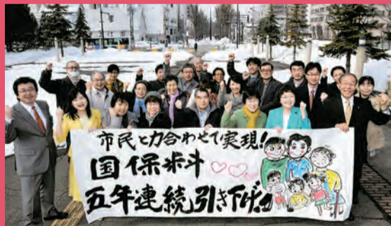
●国保料5年連続引き下げを実現し、運動をおこした市民と喜ぶ党道議と旭川市議団ら。

国が市町村に対して国保への支援(国庫負担割合)を減らしたことで、高い国保料(税)が押しつけられています。 党旭川市議団は、民商などが集めた約1万7千筆の引き下げ署名を力に、議会でも引き下げを提案。 一般会計から国保会計への繰り入れもさせて、2011年から5年連続引き下げに。2017年も1世帯あたり5003円の引き下げを実現しました。