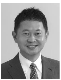
衆議院議員 西谷 康弘

これまで100回、200回と様々な政府交渉を行ってきましたが、今回ほど怒りに震える交渉はありませんでし