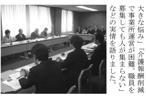
大きな悩み―「介護報酬削減で事業所運営が困難。職員を募集しても人が集まらない」などの実情を語りました。

不足は深刻。賃上げなどの労働環境の改善は急務」などの意見が出されました。 要望では、①子どもの医療費助成制度の拡充②介護保険の負担軽減と給付改善③地域医療構想の策定にあたって安易な病床削減をしないことなどを求めました。 参加者は「親にとって保育料、医療費の負担は