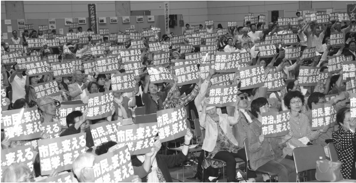
「市民は変える 選挙を変える」のフライヤーを一斉に掲げて氣勢をあげる参加者 (くにびきメッセ)

「明日を決めるのは私たち」政治を変えるよう！6・5島根県民集会」が5日、松江市で開かれ、しまね総がかり行動など実行委の主催。1000人超が参加し、会場は戦争法廃止、立憲主義回復、福島浩彦参院鳥取・島根選挙区予定候補を国会へ、の熱気に包まれました。