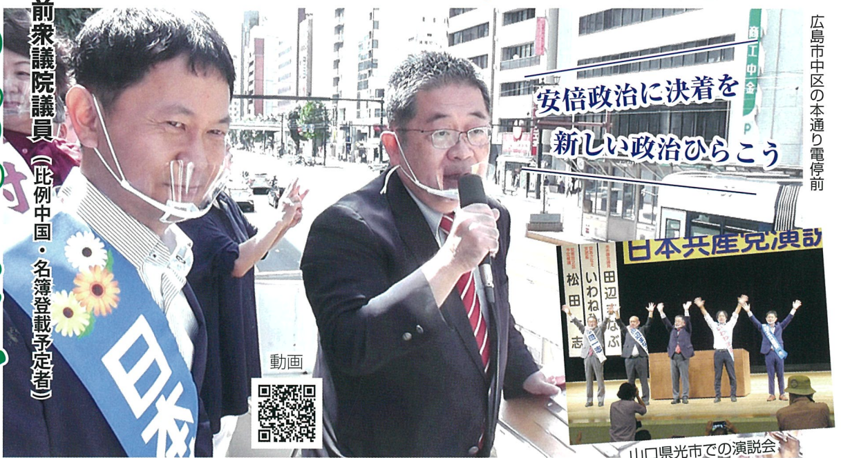
前衆議院議員 (比例中国・名簿登録予定者)