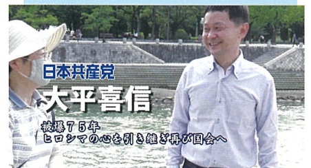
YouTube やツイッターで視聴できます